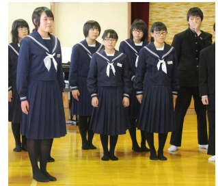
この後、スタンディングオベーションが…